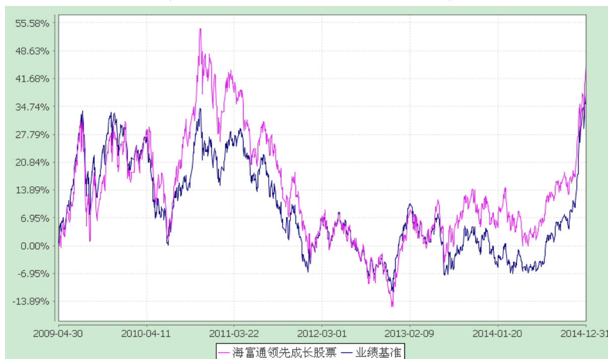
海富通领先成长股票型证券投资基金 份额累计净值增长率与业绩比较基准收益率的历史走势对比图 (2009年4月30日至2014年12月31日)

注：按照基金合同规定，本基金建仓期为基金合同生效之日起六个月，即 2009 年 4 月 30 日至 2009 年 10 月 29 日。建仓期结束时本基金投资组合均达到本基金合同第十二条（二）、（七）规定的比例限制及本基金投资组合的比例范围。