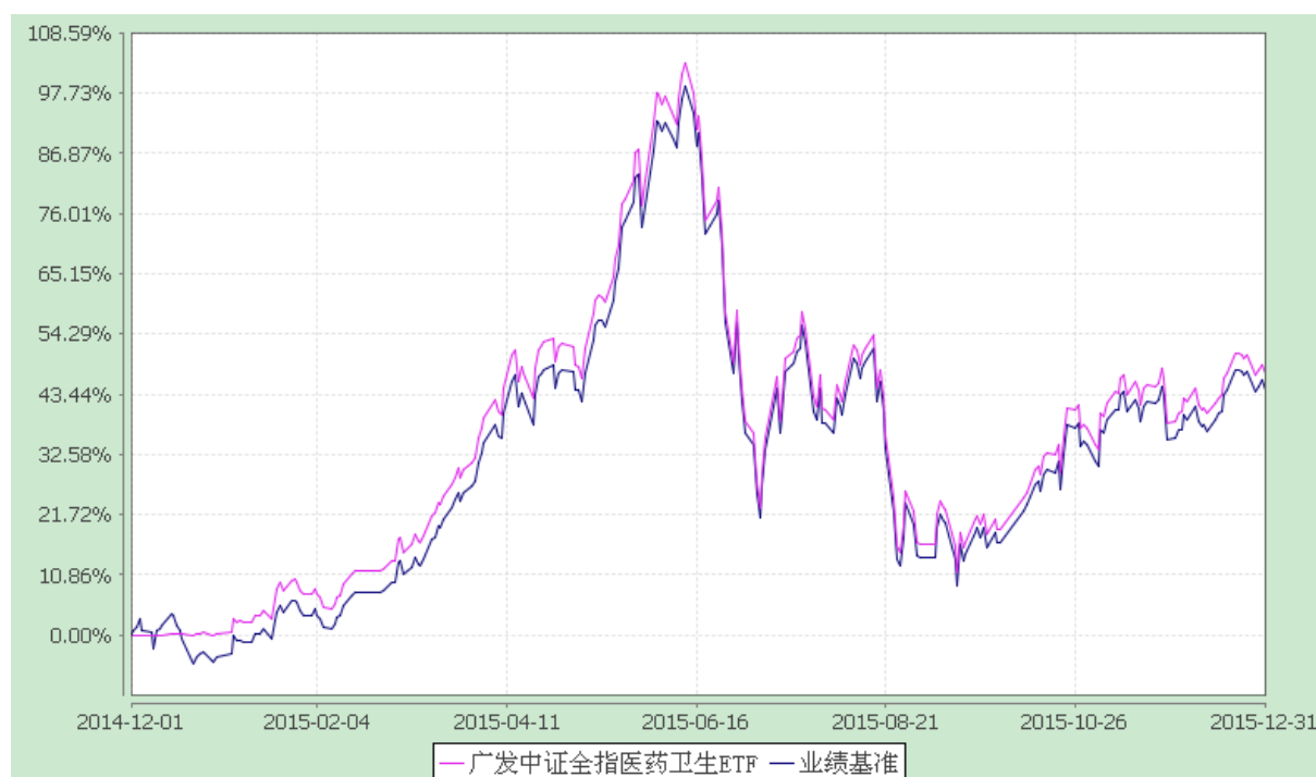
广发中证全指医药卫生交易型开放式指数证券投资基金 份额累计净值增长率与业绩比较基准收益率的历史走势对比图 (2014 年 12 月 1 日至 2015 年 12 月 31 日)