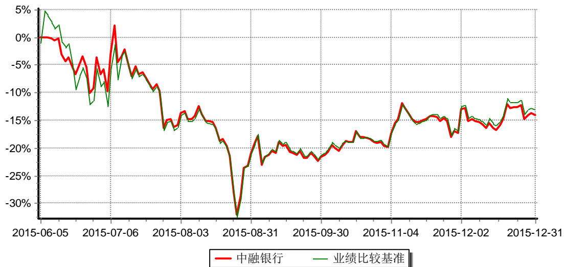
图：中融中证银行指数分级证券投资基金增长率与同期业绩比较基准收益率历史走势对比图 (2015年6月5日至2015年12月31日)