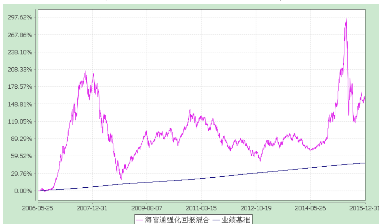
海富通强化回报混合型证券投资基金 份额累计净值增长率与业绩比较基准收益率的历史走势对比图 (2006年5月25日至2015年12月31日)

注：按照本基金合同规定,本基金建仓期为基金合同生效之日起六个月。建仓期满至今,本基金投资组合均达到本基金合同第十二条(二)、(七)规定的比例限制及本基金投资组合的比例范围。