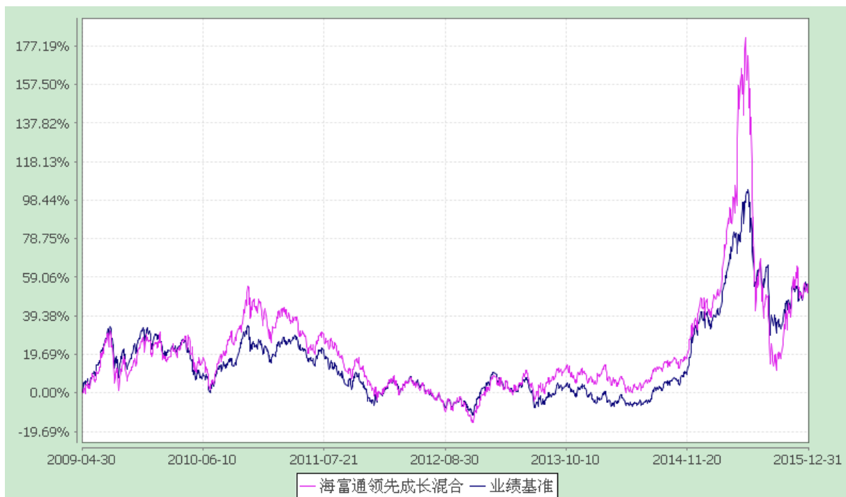
海富通领先成长混合型证券投资基金 份额累计净值增长率与业绩比较基准收益率的历史走势对比图 (2009 年 4 月 30 日至 2015 年 12 月 31 日)

注：按照基金合同规定，本基金建仓期为基金合同生效之日起六个月，即 2009 年 4 月 30 日至 2009 年 10 月 29 日。建仓期结束时本基金投资组合均达到本基金合同第十二条（二）、（七）规定的比例限制及本基金投资组合的比例范围。