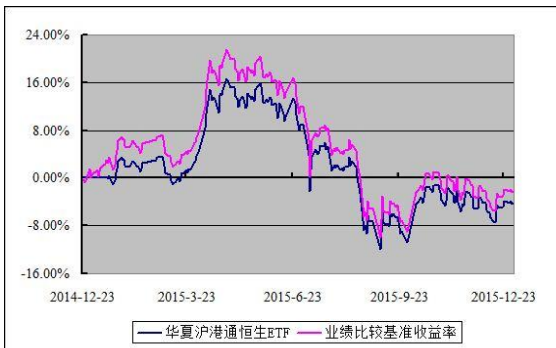
华夏沪港通恒生交易型开放式指数证券投资基金 份额累计净值增长率与业绩比较基准收益率历史走势对比图 (2014 年 12 月 23 日至 2015 年 12 月 31 日)

注：根据华夏沪港通恒生交易型开放式指数证券投资基金的基金合同规定，本基金自基金合同生效之日起 6 个月内使基金的投资组合比例符合本基金合同第十三部分“二、投资范围”、“四、投资限制”的有关约定。