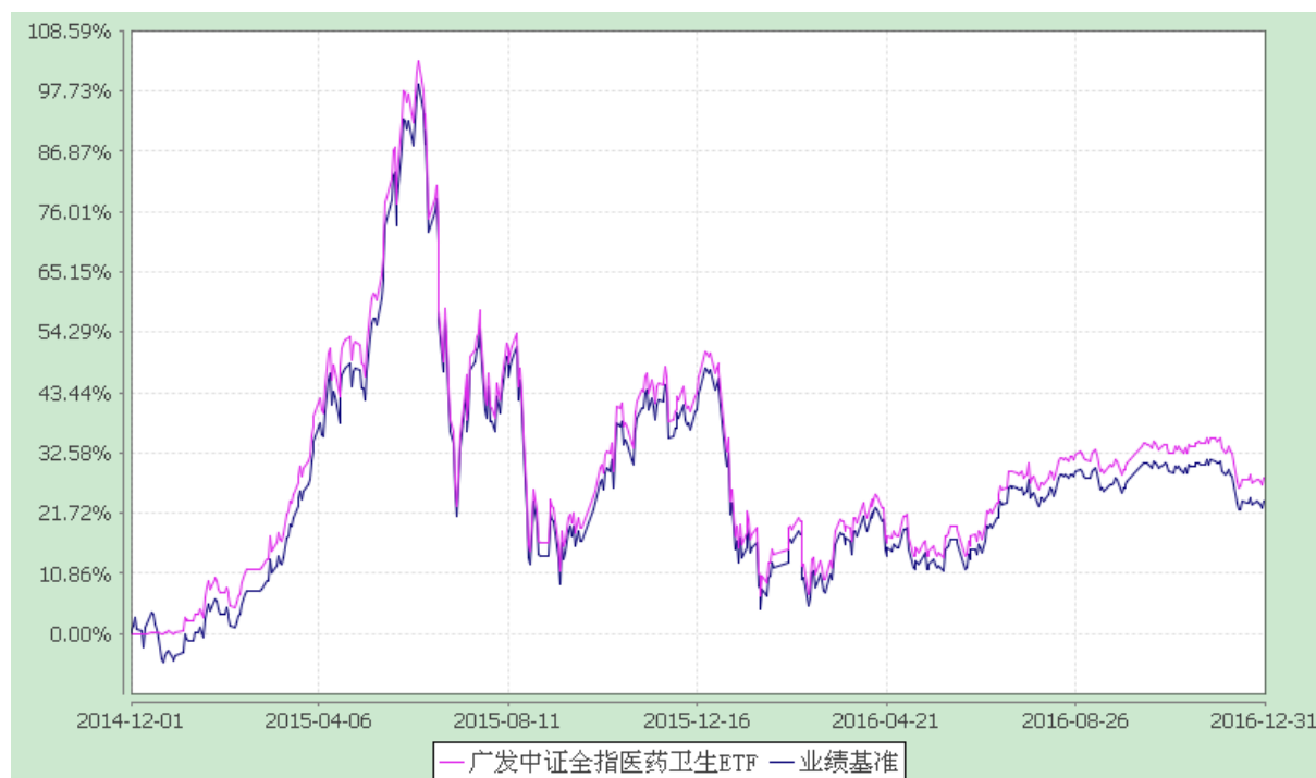
广发中证全指医药卫生交易型开放式指数证券投资基金 份额累计净值增长率与业绩比较基准收益率的历史走势对比图 (2014 年 12 月 1 日至 2016 年 12 月 31 日)