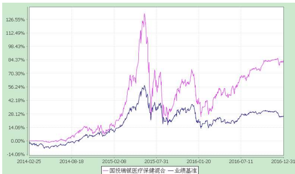
国投瑞银医疗保健行业灵活配置混合型证券投资基金 份额累计净值增长率与业绩比较基准收益率的历史走势对比图 (2014 年 2 月 25 日至 2016 年 12 月 31 日)

注：本基金建仓期为自基金合同生效日起的 6 个月。截至建仓期结束，本基金各项资产配置比例符合基金合同及招募说明书有关投资比例的约定。