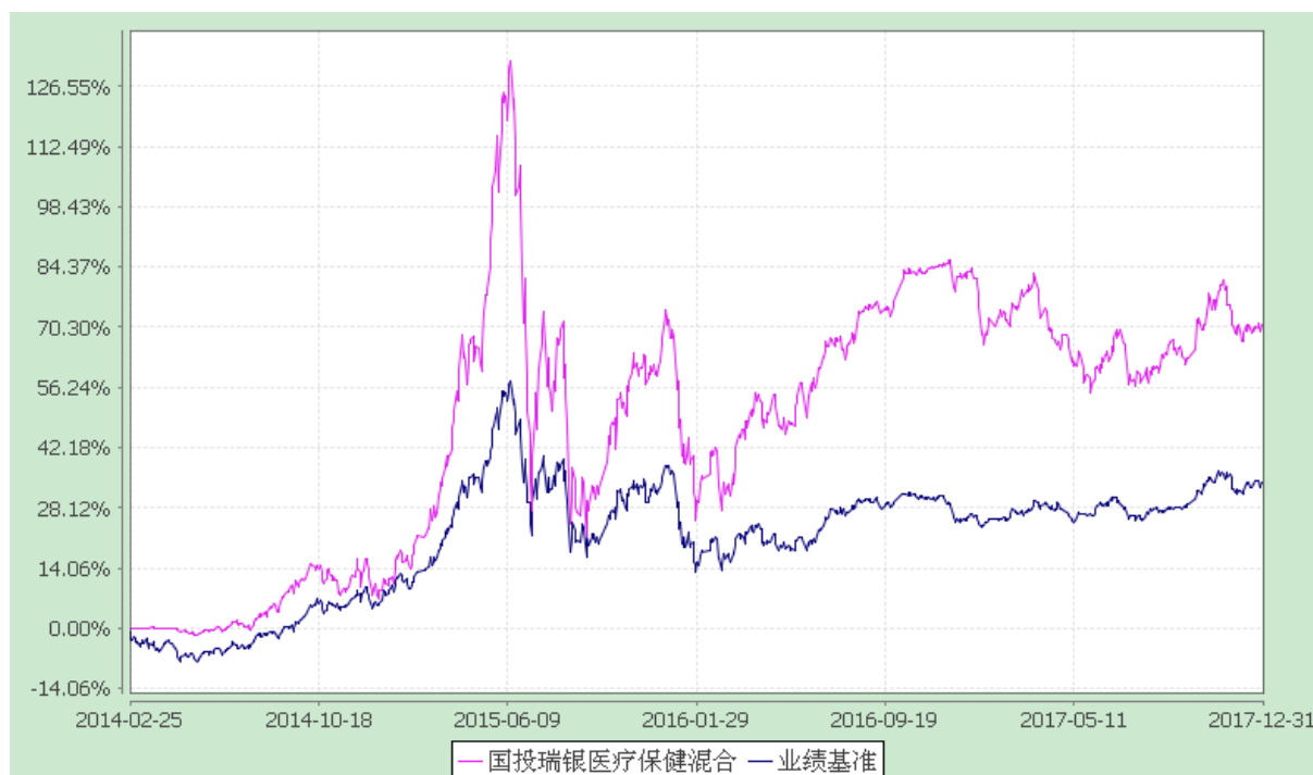
国投瑞银医疗保健行业灵活配置混合型证券投资基金 份额累计净值增长率与业绩比较基准收益率的历史走势对比图 (2014 年 2 月 25 日至 2017 年 12 月 31 日)