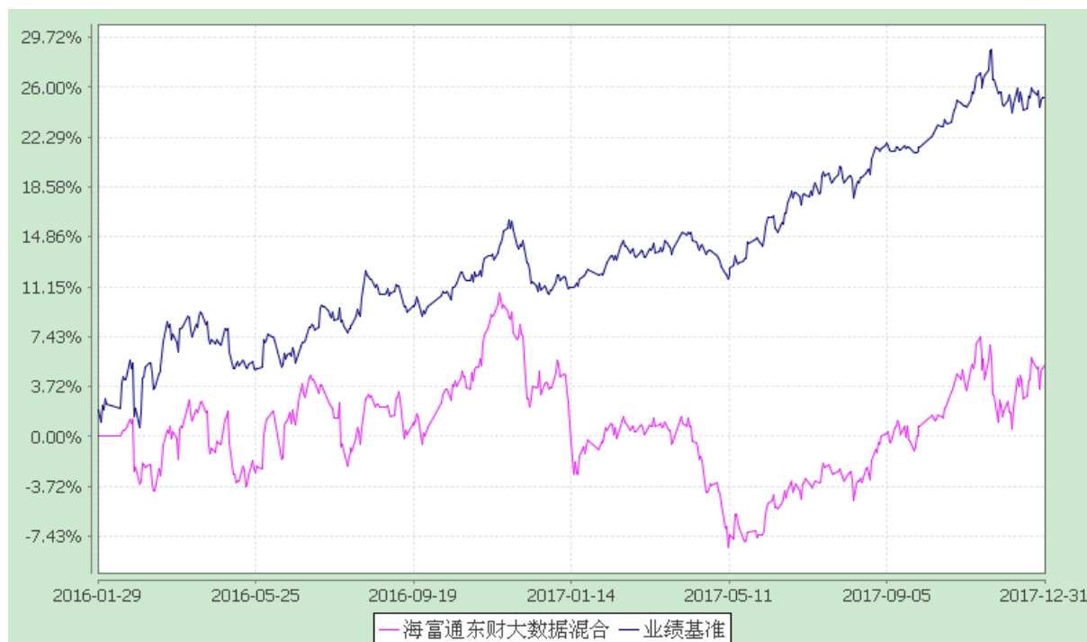
海富通东财大数据灵活配置混合型证券投资基金 份额累计净值增长率与业绩比较基准收益率的历史走势对比图 (2016年1月29日至2017年12月31日)

注：本基金合同于2016年1月29日生效，建仓期结束时本基金的各项投资比例已达到基金合同第十二部分（二）投资范围、（四）投资限制中规定的各项比例。