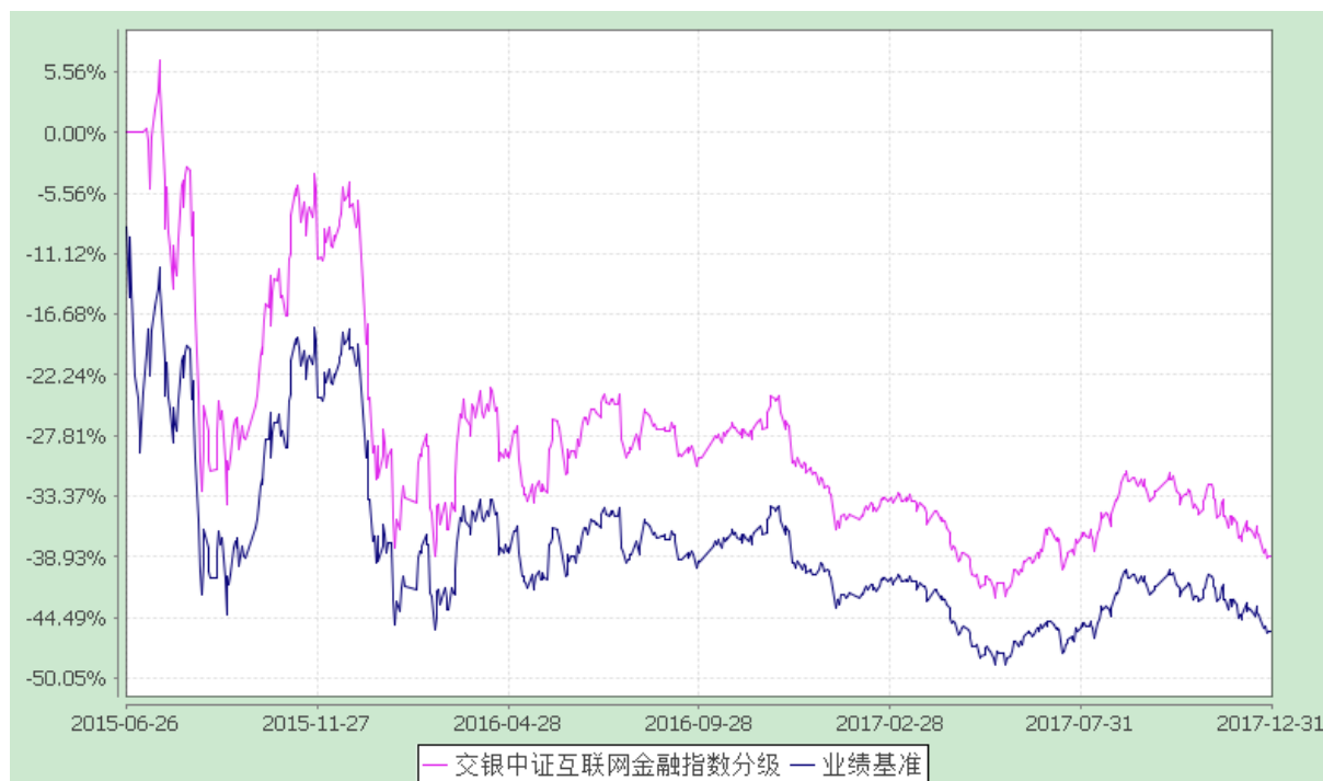
交银施罗德中证互联网金融指数分级证券投资基金 份额累计净值增长率与业绩比较基准收益率的历史走势对比图 (2015 年 6 月 26 日至 2017 年 12 月 31 日)

注：本基金建仓期为自基金合同生效日起的 6 个月。截至建仓期结束，本基金各项资产配置比例符合基金合同及招募说明书有关投资比例的约定。