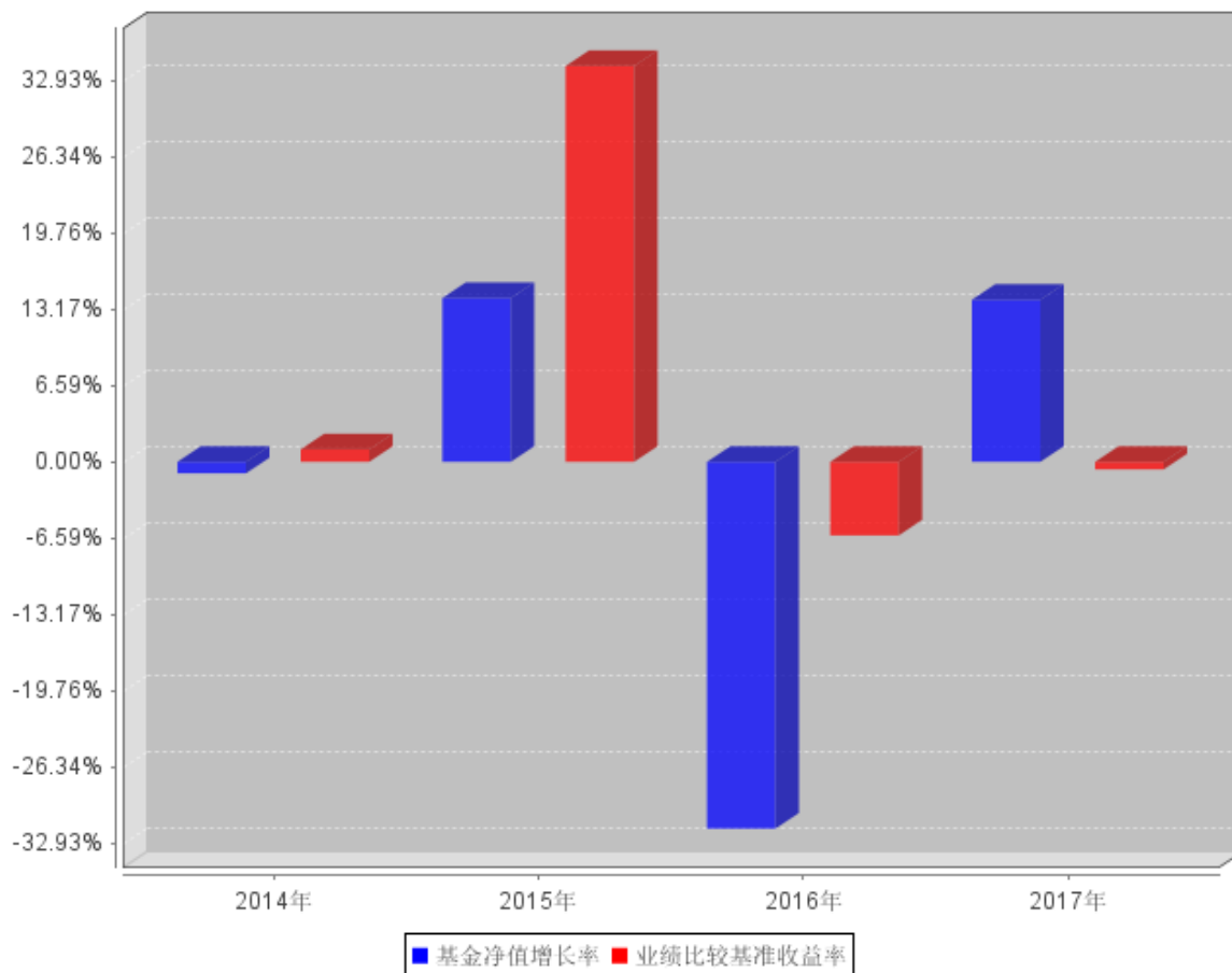
自基金合同生效以来基金每年净值增长率及其与同期业绩比较基准收益率的对比图