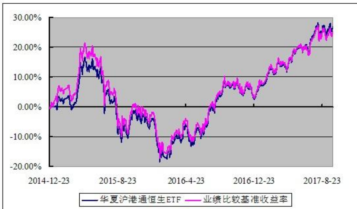
华夏沪港通恒生交易型开放式指数证券投资基金 份额累计净值增长率与业绩比较基准收益率历史走势对比图 (2014年12月23日至2017年12月31日)