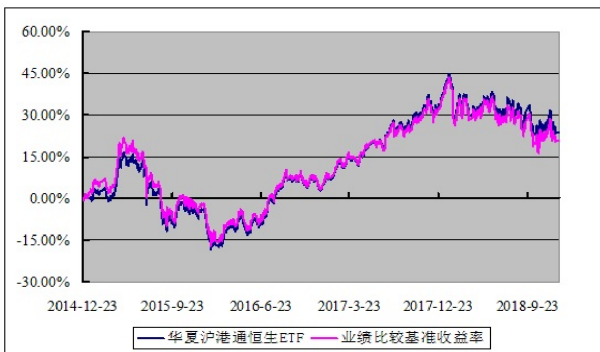
华夏沪港通恒生交易型开放式指数证券投资基金 基金份额累计净值增长率与业绩比较基准收益率的历史走势对比图 (2014 年 12 月 23 日至 2018 年 12 月 31 日)