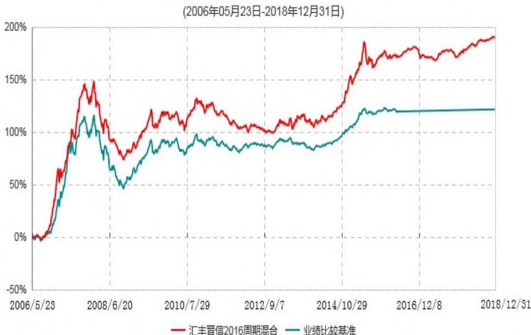
汇丰晋信2016生命周期开放式证券投资基金累计净值增长率与业绩比较基准收益率历史走势对比图