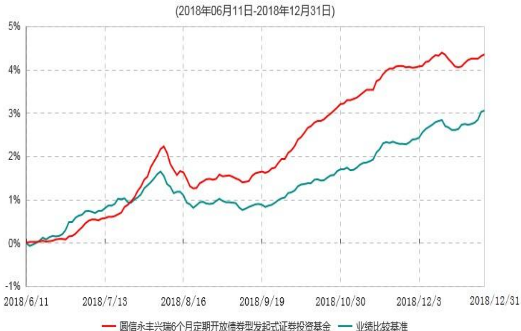
圆信永丰兴瑞6个月定期开放债券型发起式证券投资基金累计净值增长率与业绩比较基准收益率历史走势对比图

注：自基金合同生效后，截止报告期末，本基金成立不满一年；本基金已完成建仓但报告期末距建仓结束不满一年，建仓结束时各项资产配置比例符合合同约定。