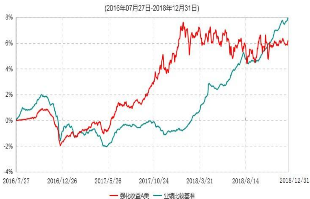
强化收益A类累计净值增长率与业绩比较基准收益率历史走势对比图