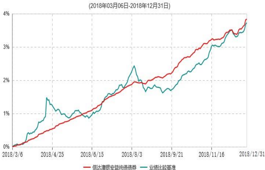
信达澳银安益纯债债券型证券投资基金累计净值增长率与业绩比较基准收益率历史走势对比图