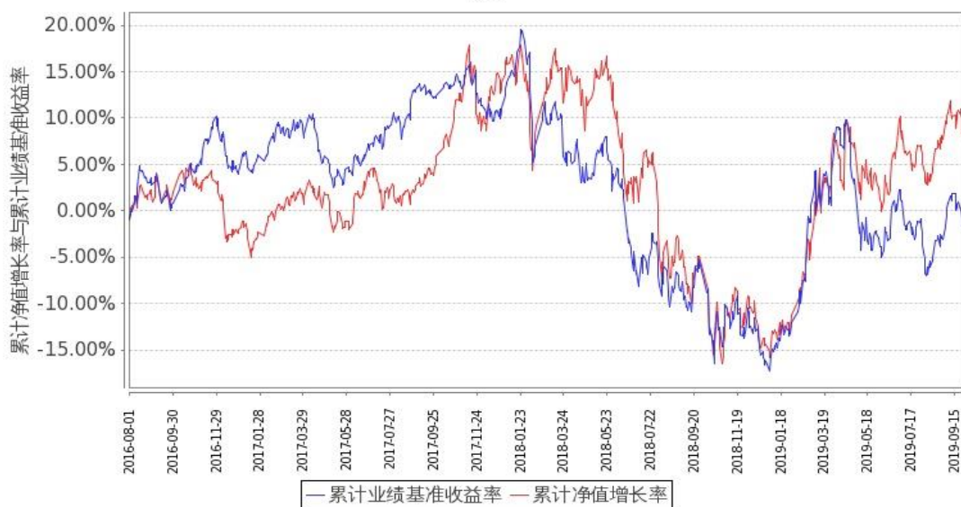
图 2：嘉实成长收益混合 H 基金份额累计净值增长率与同期业绩比较基准收益率的历史走势对比图