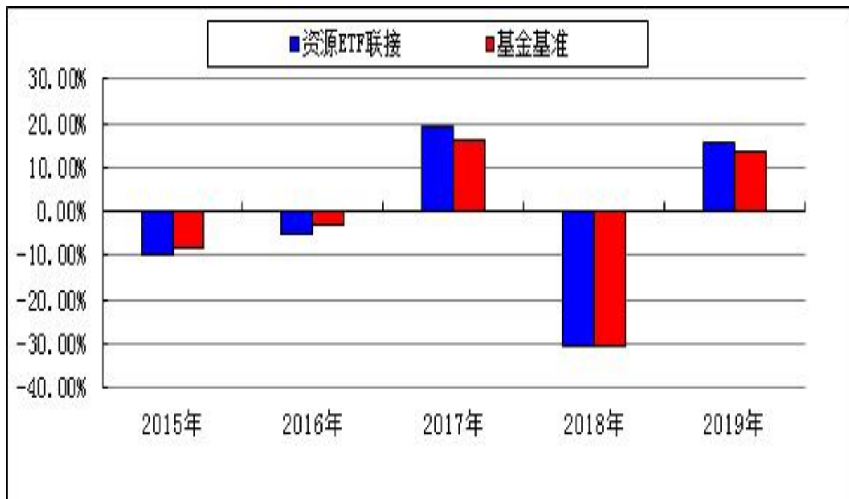
过去五年基金净值增长率与业绩比较基准收益率的对比图