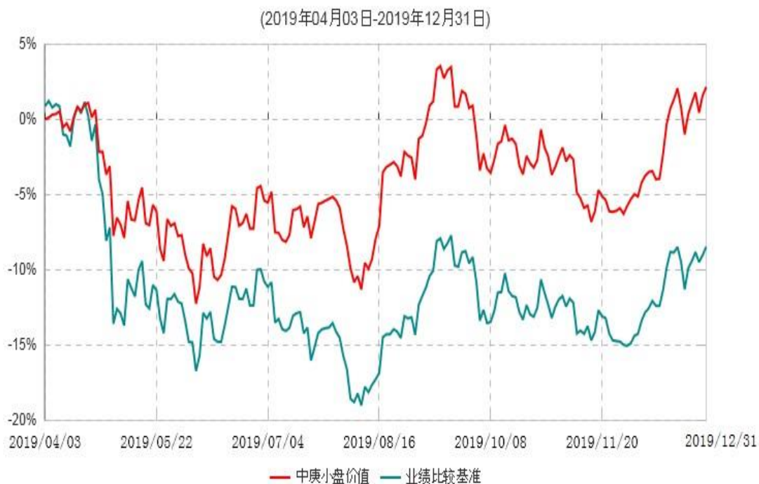
中庚小盘价值股票型证券投资基金累计净值增长率与业绩比较基准收益率历史走势对比图

注：1. 本基金基金合同于2019年4月3日生效，截至报告期末本基金基金合同生效未满一年。