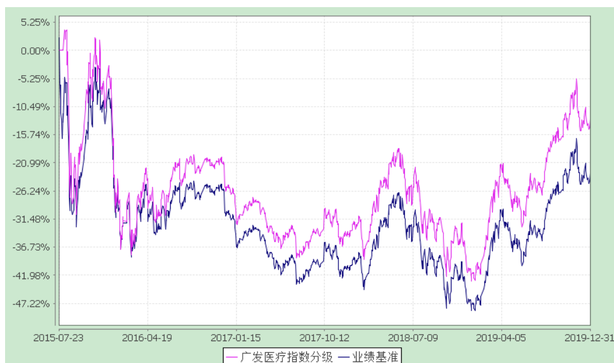
广发中证医疗指数分级证券投资基金 份额累计净值增长率与业绩比较基准收益率的历史走势对比图 (2015 年 7 月 23 日至 2019 年 12 月 31 日)