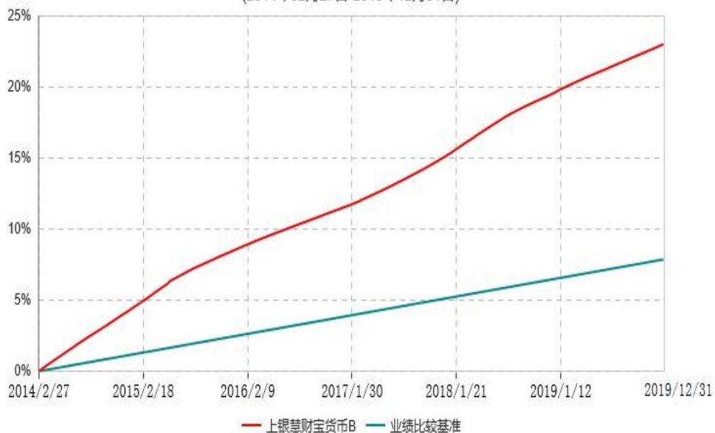
上银慧财宝货币B累计净值收益率与业绩比较基准收益率历史走势对比图 (2014年02月27日-2019年12月31日)