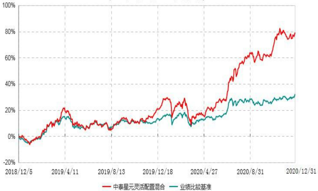
中泰星元价值优选灵活配置混合型证券投资基金累计净值增长率与业绩比较基准收益率历史走势对比图 (2018年12月05日-2020年12月31日)