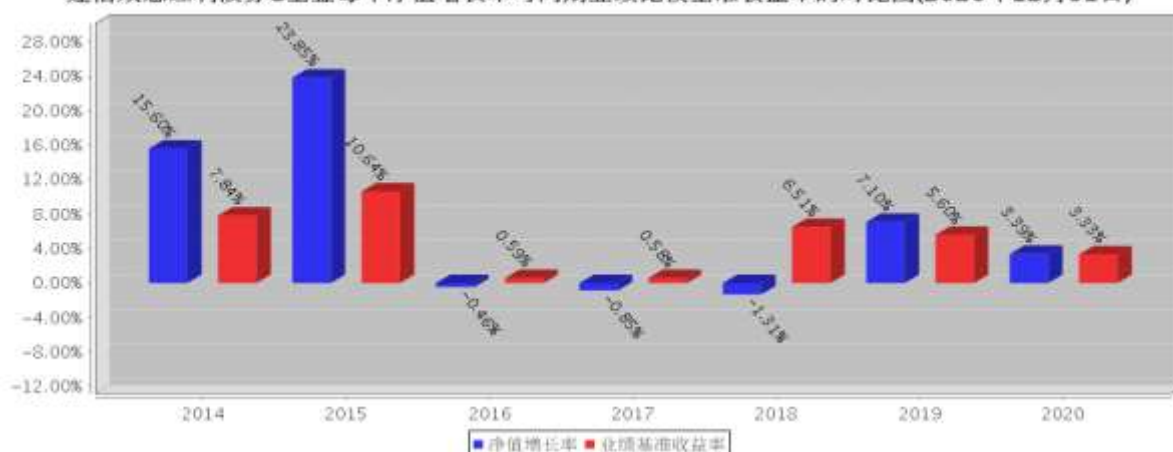
建信双息红利债券C基金每年净值增长率与同期业绩比较基准收益率的对比图(2020年12月31日)