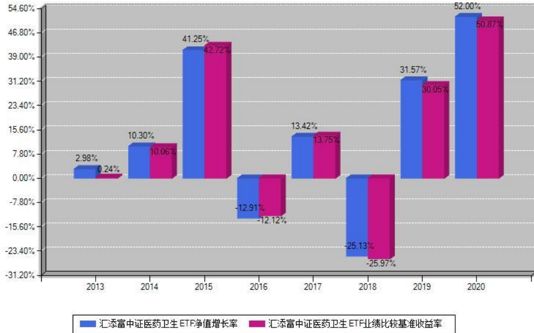
汇添富中证医药卫生ETF每年净值增长率与同期业绩基准收益率对比图

注：基金的过往业绩不代表未来表现。本《基金合同》生效之日为2013年08月23日，合同生效当年按实际存续期计算，不按整个自然年度进行折算。