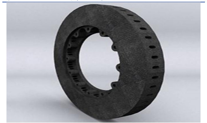
图 3：公司飞机碳刹车预制件