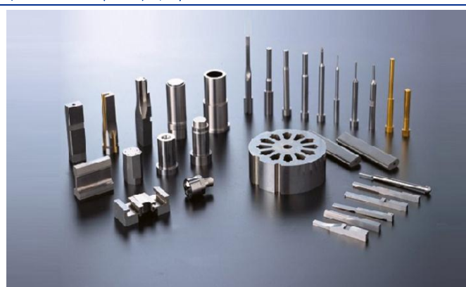
图 5：顶立科技新材料