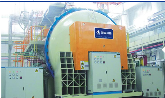
图 4：顶立科技高端热工装备

顶立科技业绩弹性在于新材料业务落地。目前顶立科技在稳定高端热工装备产品的基础上，逐步向高温合金材料、特种功能材料、再制造材料等特种复合材料延伸，目前新材料业务如高纯石墨和 3D 打印等方面已取得突破，建成金属 3D 打印粉体材料及制品生产线，研制出钛基、铝基、钴基、不锈钢粉体材料及制品，并且在颗粒细粉率、致密度等性能参数上已达到国际领先水平。顶立科技 16-18 年收入分别为 1.55、2.04、1.87 亿元，净利润为 5234、7329、6340 万元，净利率 33.7%、35.9%、33.90%，18 年由于顶立科技厂区搬迁有一定影响，预计装备业务后续发展较为稳定，业绩弹性在于新材料业务拓展，关注后续石墨提纯、3D 打印等新材料产业化落地。