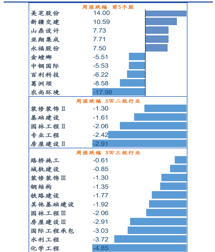
图 2: 个股及子行业涨跌幅情况(%)